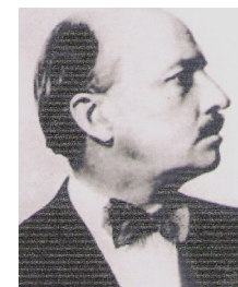
Filippo Tommaso Marinetti